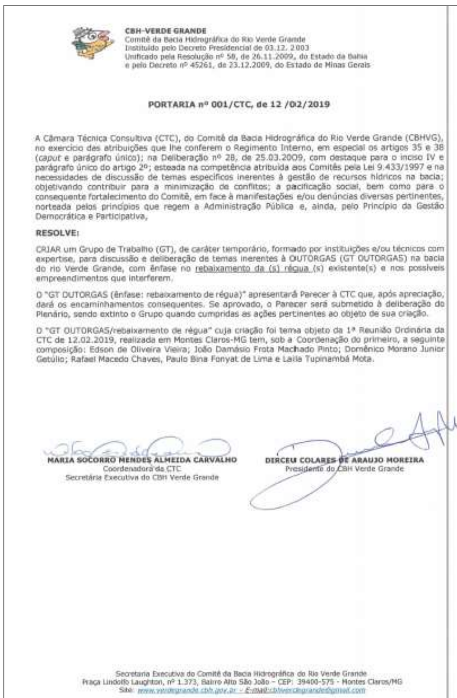
Figura 01: Portaria de criação do Grupo de Trabalho