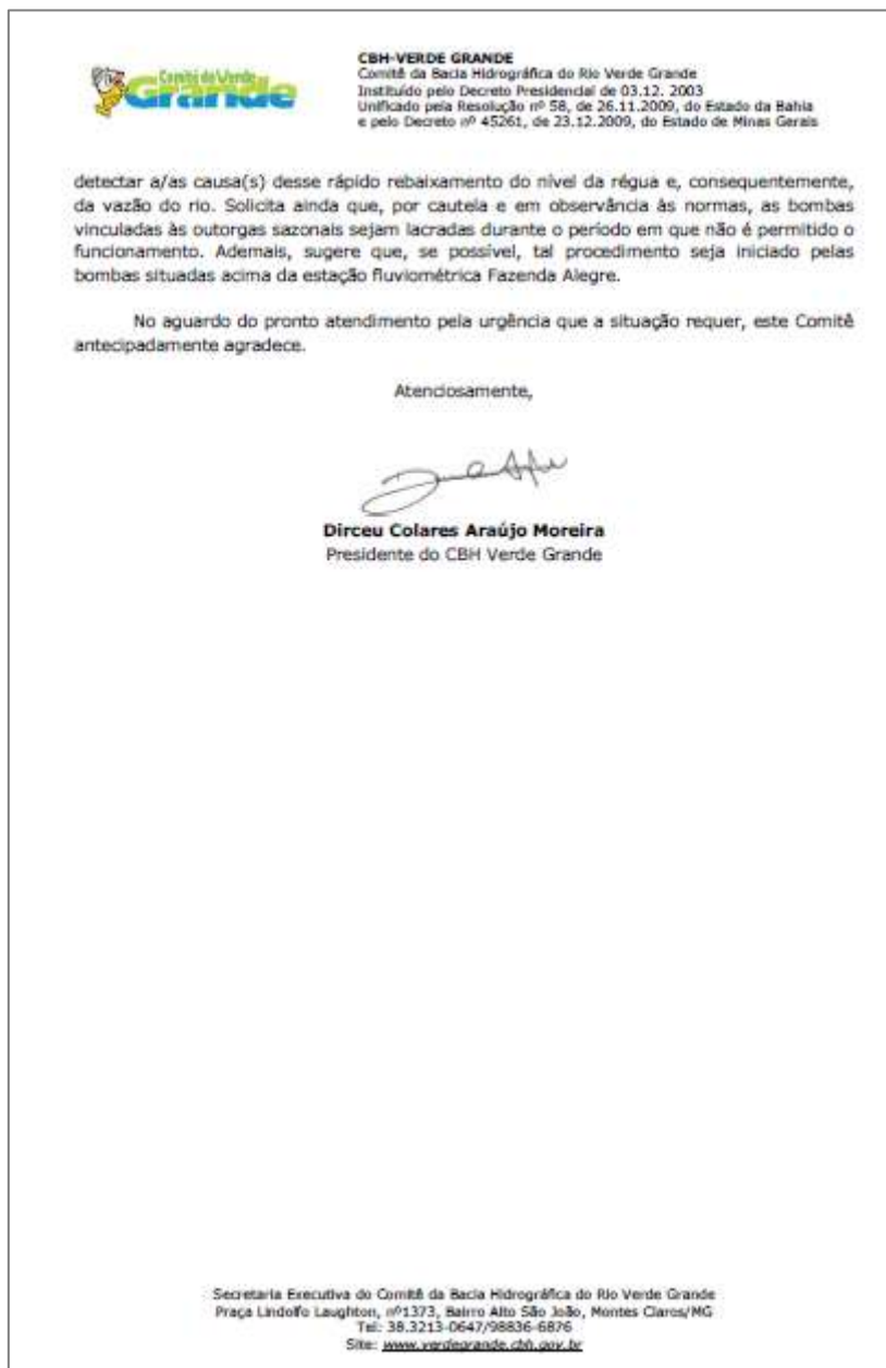
Figura 04: Ofício CBHVG nº 125/201 encaminhado à ANA, solicitando urgente fiscalização das bombas situadas a montante da estação fluviométrica Fazenda Alegre

Comitê da Bacia Hidrográfica do Rio Verde Grande Instituído pelo Decreto Presidencial de 03.12.2003 Unificado pela Resolução nº 58, de 26.11.2009, do Estado da Bahia e pelo Decreto nº 45261, de 23.12.2009, do Estado de Minas Gerais