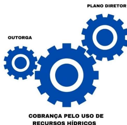
Figura 01 – Integração dos instrumentos de gestão

De outro modo, a cobrança pelo uso de recursos obtém recursos financeiros para custear as ações previstas nos Planos Diretores das bacias hidrográficas, possibilitando assim a execução de medidas que visem a preservação e melhoria da quantidade e qualidade dos recursos hídricos.